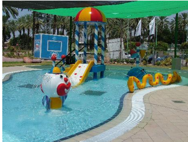
בריכת פעוטות "בית אייל" בקיבוץ אשדות יעקב

אם כך אזי שיקול הדעת עומד לפתחו של מחזיק הבריכה, ואכן בבריכות פעוטות רבות מציבים מחזיקי בריכות השחייה משגיחים ואף לעתים מצילים מוסמכים, וטוב שכך.