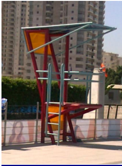
עמדת הצלה בספורטן פ"ת

תקנות הסדרת מקומות רחצה (בטיחות בבריכות שחייה), התשס"ד – 2004 קובעות, בין השאר, כי בכל אתר בריכת שחייה תהיה עמדת הצלה שתאפשר גישה מיידית למים ותצפית נוחה על שטח בריכת השחייה. תקנות התכנון והבניה לבריכות שחיה משנת 2008 מגדילות לעשות וקובעות, בין השאר, כי העמדה תהיה מוגבהת, וכי מיקומה וממדיה ייקבעו באופן שיאפשר למציל את מירב השליטה על הנעשה בבריכה ועל ציוד ההצלה והעזרה הראשונה, לרבות אחסנתם. פניות שונות הופנו אלינו בסוגיה זו ותשובתנו היא חד-משמעית – נדרשת עמדה מוגבהת , מובלטת ומוצללת. כיסא מציל עם שולחן לידו איננם עמדת הצלה.