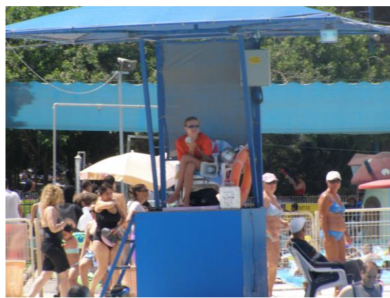
מצילה בעמדת הצלה בפארק המים נחשנית

בהעדר הסכם קיבוצי מיוחד למצילי בריכות, שעות עבודתם נקבעת עפ"י חוקי העבודה (חוק שעות עבודה ומנוחה, התשי"א-1951), לפיהם אין הגבלה בשעות העבודה להוציא הוראה שבכל 6 שעות עבודה מחויבת הפסקה של חצי שעה לפחות. כלל זה אינו מוריד מחובת הזהירות של מחזיקי הבריכה לשיקול דעת לשעות עבודה סבירות של מציל האחראי על חיי אדם. בהקשר לכך ראוי לציין כי לאור זאת שתקנות הסדרת מקומות רחצה (בטיחות בבריכות שחייה), התשס"ד – 2004 קובעות, בין השאר, כי אסור למציל לעזוב את עמדת ההצלה עד שיחליפו מציל אחר, רצוי מאד שמחזיקי הבריכה יתארגנו לכך שבבריכה יהיו מצילים כשירים שיוכלו להחליף את המציל הפעיל לעשיית צרכיו או כל צורך אחר, מבלי שזה יצטרך לנטוש את משמרתו ולעבור על החוק, עם כל המשתמע מכך.