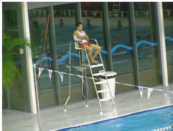
עמדת מציל מוגבהת ומאוישת במרכז ספורט ונופש חדיש ב- "ליון שבצרפת"

בפוסט זה מספר סוגיות מרכזיות לגבי עבודת המצילים כגון - האם מותר למציל לעסוק במטלות אחרות מלבד עבודת ההצלה, האם נדרש להציב מציל בבריכת הפעוטות, האם קיימת מגבלה בהיקף שעות העבודה של המצילים ומהי עמדת הצלה תקנית. סוגיות שמן הראוי לתת עליהם את הדעת ולפעול לפיהן בשיקול דעת מרבי.