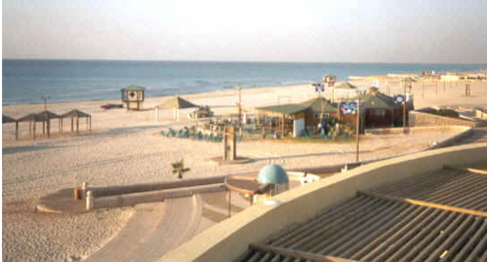
חופי ראש"צ - הכניסה הדרומית ותחנה מספר 2 שמשמלה לכיוון תחנה מספר 1 אירע המקרה

עמידה בכל דרישות הבטיחות המעוגנות בחוקים תקנות ונהלי משרד הפנים כגון שילוט והנחיות לקהל הרחב הראויים לדוגמה. עיריית ראש"צ התקינה חוק עזר בתוקף סמכותה לפי סעיף 250 לפקודת העיריות המקומיות וסעיף 6 לחוק הסדרת מקומות רחצה, תשכ"ד – 1964 שבו הודגש בסעיף 3 כי הרחצה אסורה ולא ירחץ אדם אלא בשעות הרחצה.